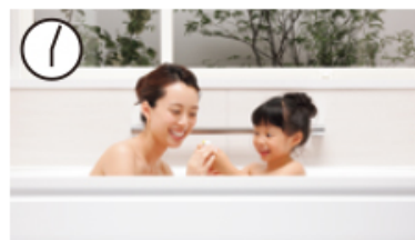
お母さんとお子さんの入浴後