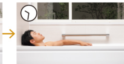
お仕事から帰宅後のお父さんの入浴